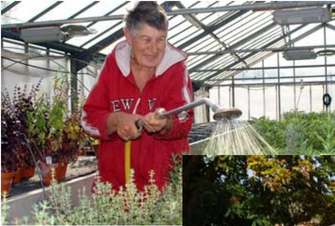
Zu den Einrichtungen der Vorwerker Diakonie zählt auch der Bio-Gemüsehof Ziegelhorst im Landkreis Herzogtum Lauenburg, südlich von Lübeck.