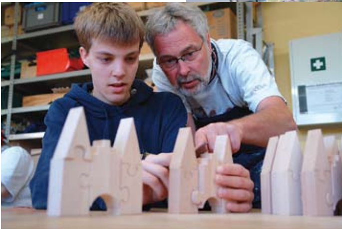
In den Werkstätten der Vorwerker Diakonie sind über 700 Menschen mit Behinderungen tätig.