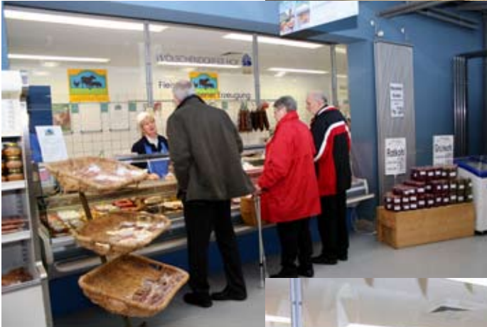
Die landwirtschaftlichen Produkte werden u.a. über den eigenen Bioladen vertrieben.