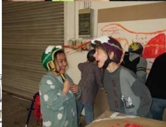
oben: Schüler und Künstler in Aktion. links: Sandspieltisch und Wasserspieltisch im neu geschaffenen Spielbereich. Skizze & Fotos: Elke Paternoster