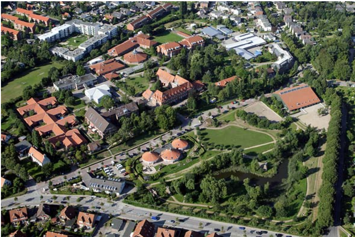
Luftaufnahme des Zentralgeländes der Vorwerker Diakonie in Lübeck

Im vergangenen Sommer fiel der Startschuss für eine Neuverfilmung des Romans „Die Buddenbrooks“. Mit von der Partie: Armin Müller-Stahl und Iris Berben. Für seinen Roman erhielt der berühmteste Sohn der Stadt, Thomas Mann, im Jahre 1929 den Literatur-Nobelpreis.