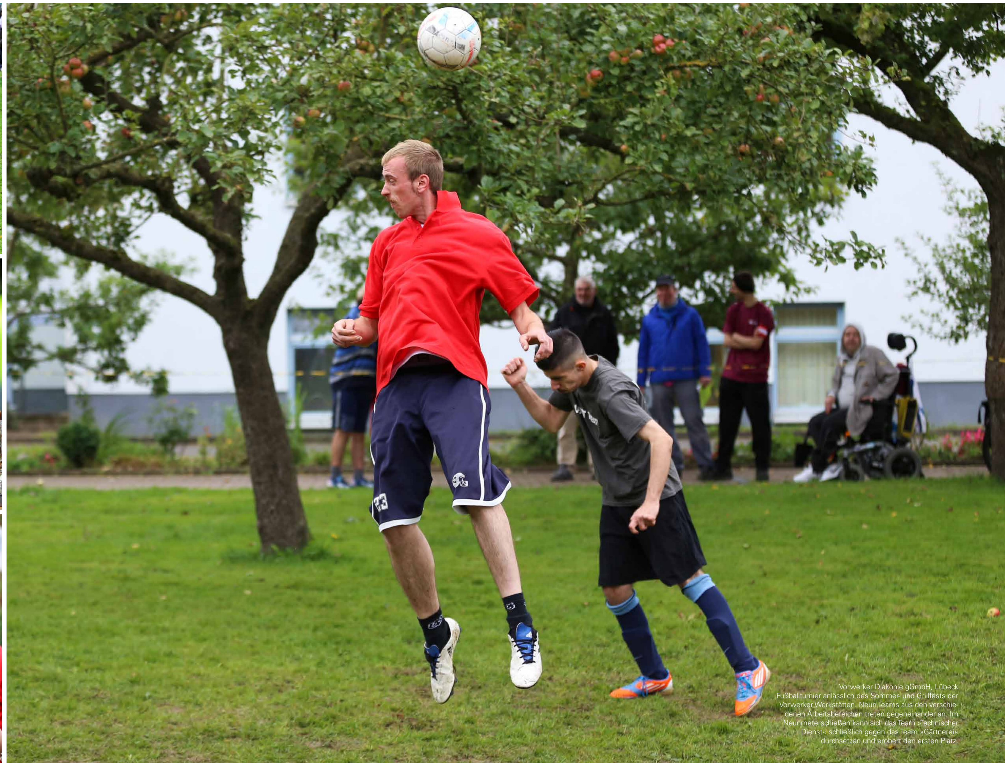
Vorwerker Diakonie gGmbH, Lübeck Fußballturnier anlässlich des Sommer- und Grillfests der Vorwerker Werkstätten. Neun Teams aus den verschie- denen Arbeitsbereichen treten gegeneinander an. Im Neunmeterschießen kann sich das Team »Technischer Dienst« schließlich gegen das Team »Gärtnerei« durchsetzen und erobert den ersten Platz.