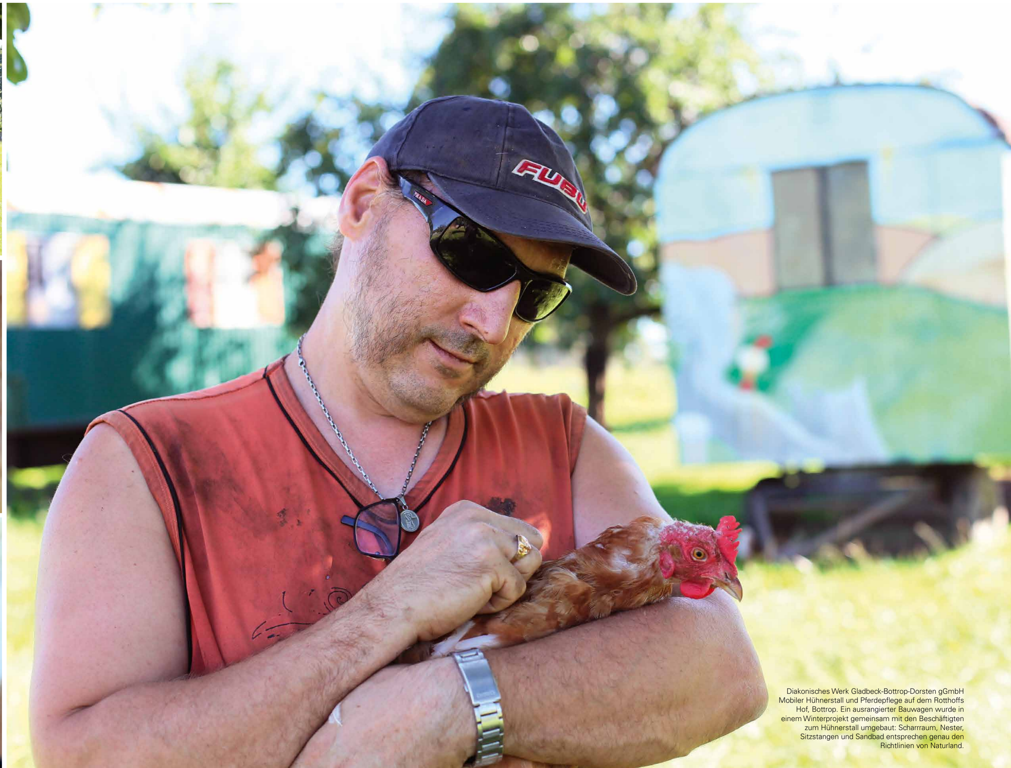
Diakonisches Werk Gladbeck-Bottrop-Dorsten gGmbH Mobiler Hühnerstall und Pferdepflege auf dem Rothoffs Hof, Bottrop. Ein ausrangierter Bauwagen wurde in einem Winterprojekt gemeinsam mit den Beschäftigten zum Hühnerstall umgebaut: Scharrraum, Nester, Sitzstangen und Sandbad entsprechen genau den Richtlinien von Naturland.