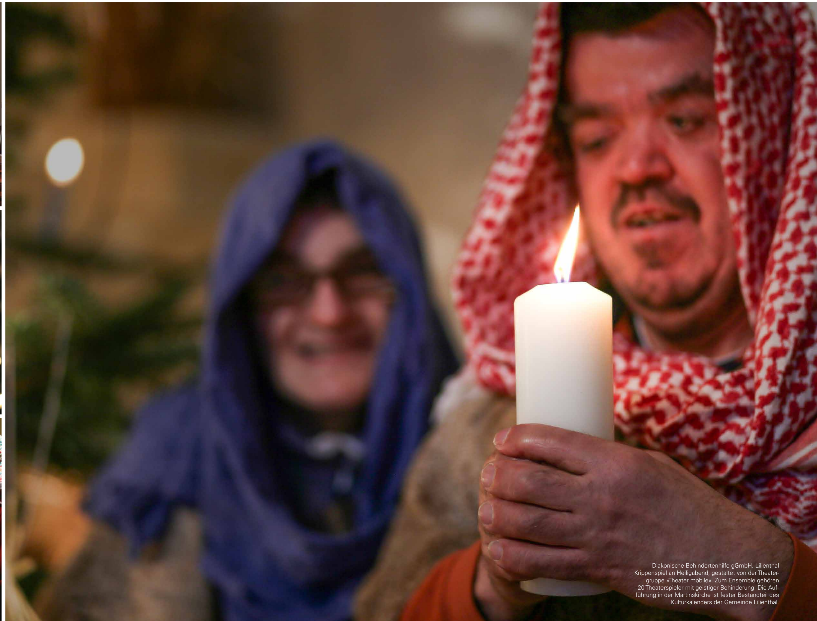
Diakonische Behindertenhilfe gGmbH, Lilienthal Krippenspiel an Heiligabend, gestaltet von der Theater- gruppe »Theater mobile«. Zum Ensemble gehören 20 Theaterspieler mit geistiger Behinderung. Die Auf- führung in der Martinskirche ist fester Bestandteil des Kulturkalenders der Gemeinde Lilienthal.