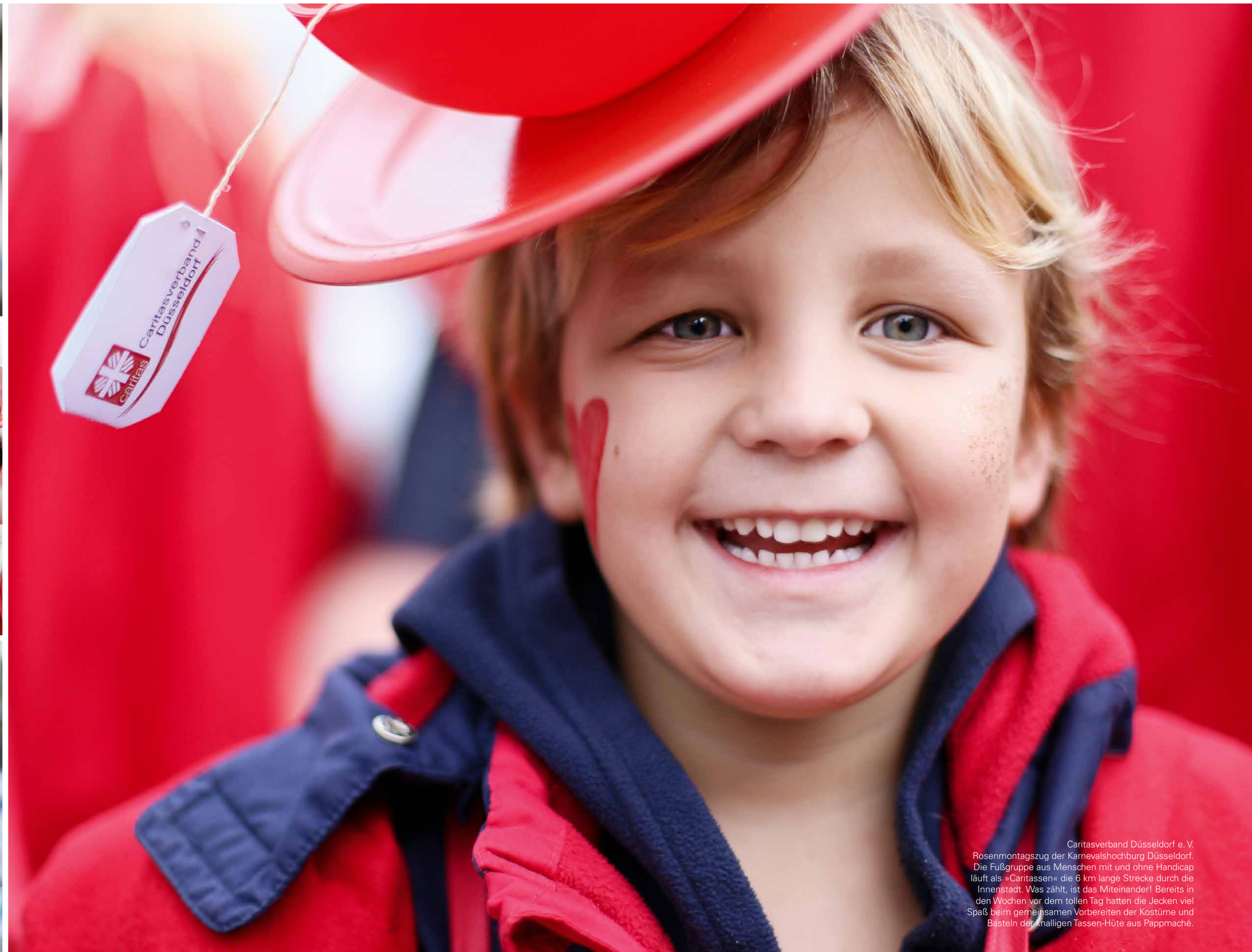
Caritasverband Düsseldorf e.V. Rosenmontagszug der Karnevalshochburg Düsseldorf. Die Fußgruppe aus Menschen mit und ohne Handicap läuft als »Caritassen« die 6 km lange Strecke durch die Innenstadt. Was zählt, ist das Miteinander! Bereits in den Wochen vor dem tollen Tag hatten die Jecken viel Spaß beim gemeinsamen Vorbereiten der Kostüme und Basteln der knalligen Tassen-Hüte aus Pappmaché.